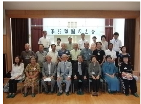
第85回園の友会 記念撮影