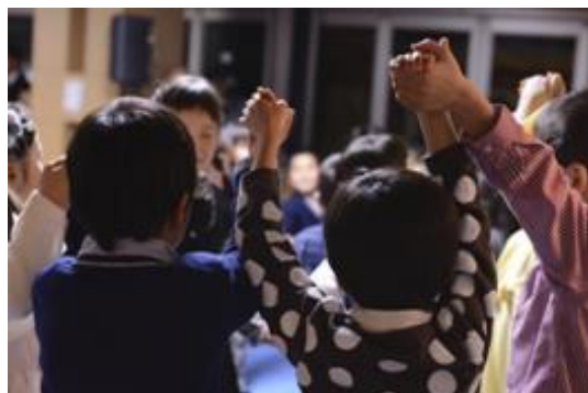
『小さな子ども達のダンス』